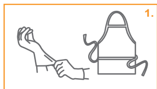
1. Φορέστε τον κατάλληλο προστατευτικό εξοπλισμό.

Επιπλέον, τα κιτ χλωρίνης δεν είναι δυνατό να χρησιμοποιηθούν σε ούρα - απαιτούνται δύο διαφορετικά κιτ, ένα για αίμα και ένα άλλο για ούρα. Τα Πανάκια Εκκρίσεων Clinell® δημιουργήθηκαν ώστε να κάνουν πιο εύκολο τον καθαρισμό των εκκρίσεων του σώματος. Αυξάνουν τη συμμόρφωση με τους κανόνες, σε αυτή τη συχνή, αλλά ιδιαίτερα αμελή από πολλούς διαδικασία ελέγχου των μολύνσεων, με οικονομικό μάλιστα τρόπο.