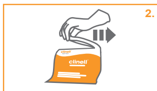
2. Σχίστε για να ανοίξετε τη σακούλα.