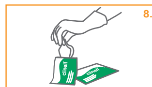
8. Αφαιρέστε ένα απολυμαντικό πανί από τη συσκευασία του.