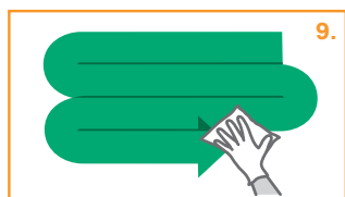
9. Καθρίστε τη περιοχή της έκκρισης με κίνηση σε σχήμα 'S', από το καθαρό σημείο προς το βρώμικο.