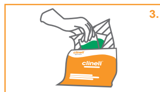
3. Αφαιρέστε τα πανάκια.