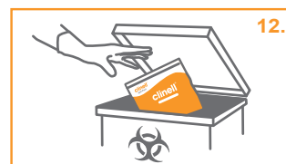
12. Πετάξτε τη σακούλα σε ένα κατάλληλο μέσο απόρριψης.