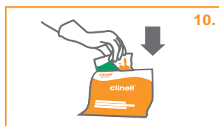
10. Τοποθετήστε το λερωμένο πανί και την άδεια συσκευασία του στη σακούλα.