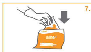
7. Τοποθετήστε το λερωμένο πανί πίσω στη σακούλα.