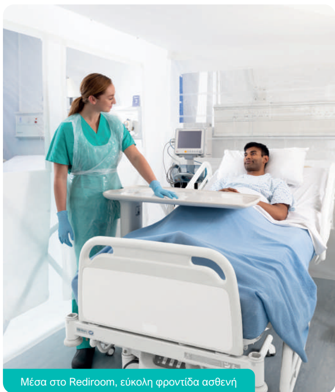
Μέσα στο Rediroom, εύκολη φροντίδα ασθενή

Χώροι φροντίδας ηλικιωμένων, καταστάσεις έκτακτης ανάγκης, αεροδρόμια και στρατιωτικές εγκαταστάσεις.